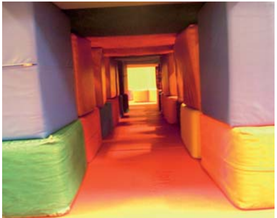
LEK Omtrent midtveis i leken opplever forfatteren at barna oppsøker å åle seg igjennom en trang, krevende passasje, og kommer ut i den andre enden med et slags nytt blikk på omgivelsene.

Behandlingene ble utført i samarbeid med fagpersoner fra andre enheter i Bar-