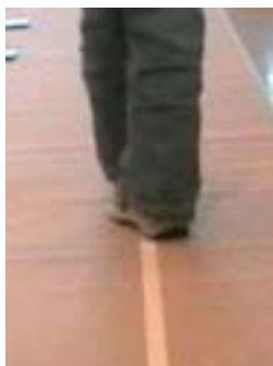
FIGUR 2 Et godkjent skritt av barn nr. 3.

barna uheldige og rettet seg selv. Det ble likevel regnet som feil. T1 testet 19 barn, og ved to tilfeller samsvarte ikke T1's vurdering med videoanalysen. I disse to tilfellene registrerte ikke T1 avstand mellom hæl og tå, noe som vist på video og som begge artikkelforfatterne var enig i under analysen. Det resulterte i poengforskjell på tre og fire poeng. T1 syntes også det var vanskelig å vurdere barn med innadrotasjon i hoften og valgusstilling i knær, fordi det gjorde det vanskelig å plassere foten rett. Dette illustreres i figur 2 der verken hæl eller tå er plassert på streken.