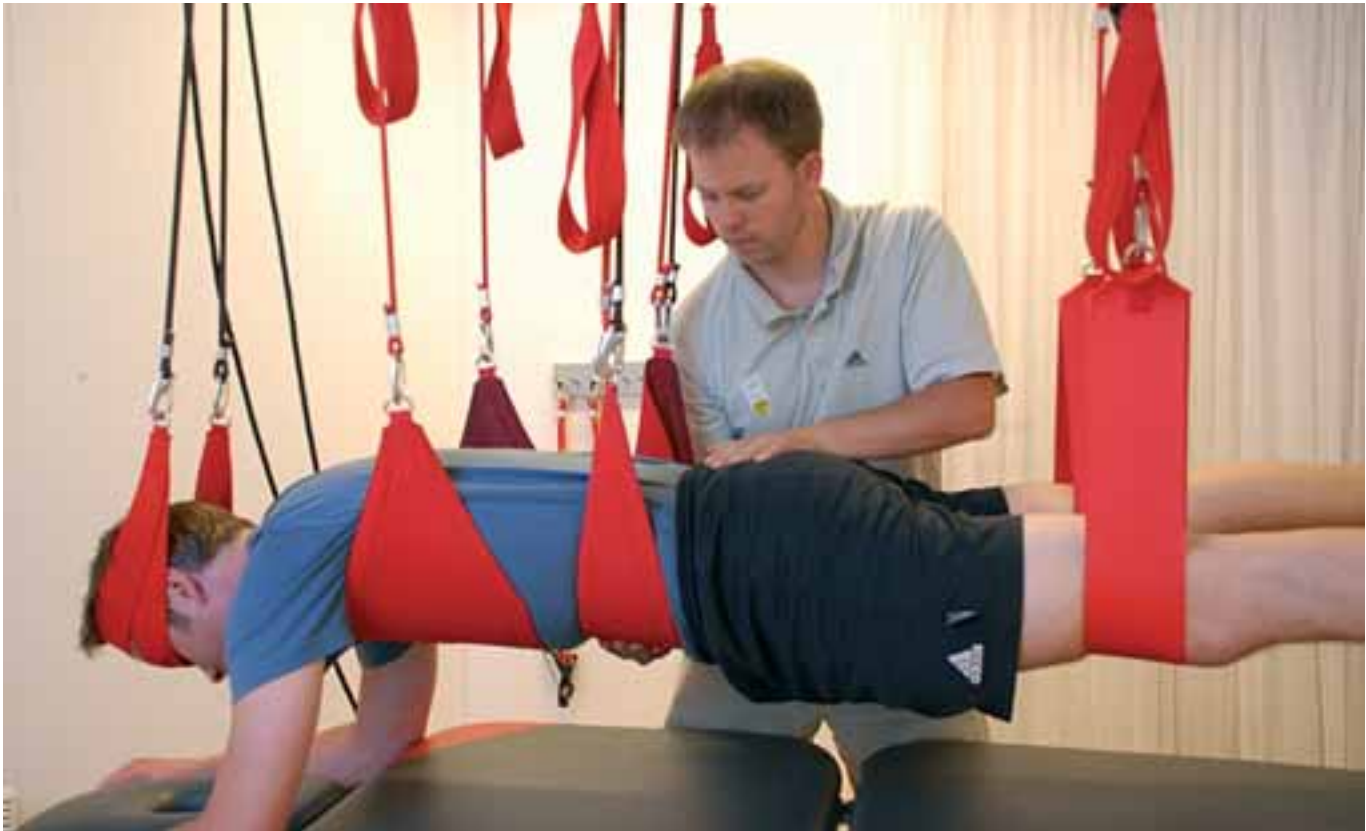
FIGUR 4 Test av holdetid i nøytral stilling for lumbalcolumna. Avlastende strikk plassert under abdomen og slynger plassert under hode, bryst og lår.

funksjonen i den dype stabiliserende (lokale) muskulaturen i rygg og nakke. Ved testing av nakken plasseres den i nøytral stilling (normal lordose) i en slynge. Deretter foretar terapeuten en liten uttetting av den cervikale lordosen som så bibeholdes av pasienten (figur 3). Mens ved testing av ryggen plasseres denne i en kroppsvektbærende posisjon med strikkavlastning på en slynge under magen. Dernest retter terapeuten ut litt av den lumbale lordosen, en posisjon som så beholdes av pasienten (figur 4).