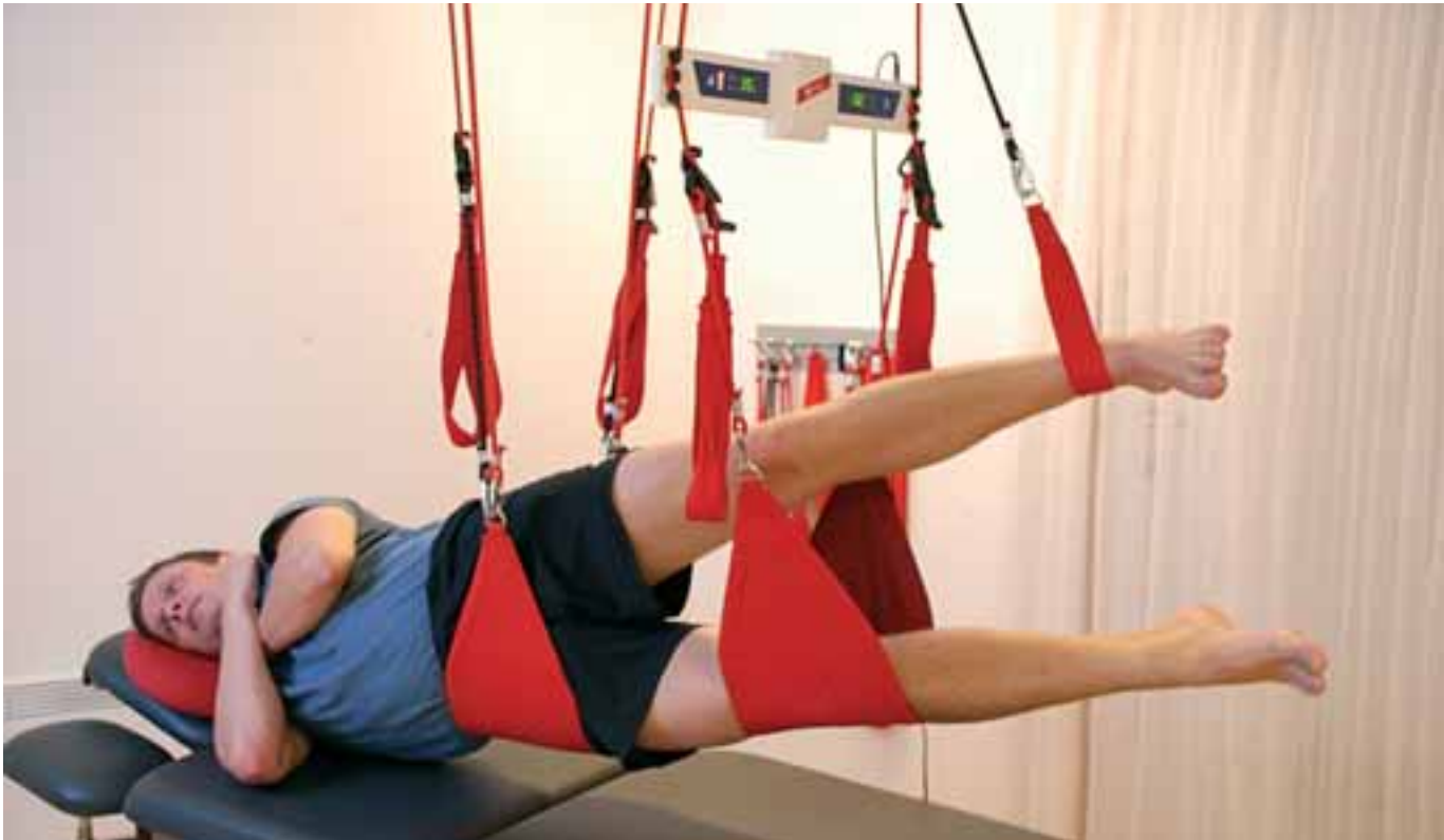
FIGUR 7 Eksempel på behandling i kroppsvektbærende posisjon med vibrasjon: Sideliggende hofteabduksjon med tyngdeavlastende strikk på slyngen under bekkenet og under det øverste beinet, samt en slynge under det nederste kneet. Strikkavlastningen på slyngen under bekkenet reduseres gradvis.

minutters hvile. Deretter oppjusteres tyngdebelastningen for hver serie (om mulig). Prosedyren gjentas så lenge som: tyngdebelastningen i øvelsen lar seg øke, smerte ikke provoseres, øvelsen utføres korrekt, pasienten ikke blir generelt trett og ønsker å stanse. Videre kan terapeuten manuelt riste på tauene for å gjøre øvelsen enda mer utfordrende. Pasienten retestes hyppig både for Weak Links og i kroppsbevegelsesfunksjoner for å se om behandlingen har gitt redusert smerte og bedret funksjon.