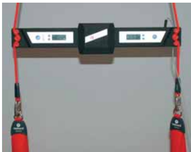
FIGUR 1 Vibrasjonsapparatet.

Etter to år (2005-2007) med utvikling av apparater og uttesting av behandlingen på et stort antall pasienter og tilstander, ble vibrasjonsapparatet Redcord Stimula satt i produksjon. Apparatet ble uttestet på rundt 800 pasienter med langvarige nakke-, skulder eller ryggplager. Dette ble gjort av syv fysioterapeuter på fire fysikalske institutter i Norge. Pasienter med plager fra rygg, bekken, hofte, nakke og skulder, som hadde blitt behandlet med Neurac-metoden ble forespurt om: «På en skala fra null til fem, hvor null er ingen bedring og fem er full smertefrihet: Hvordan har din daglige smerte endret seg fra behandlingens start til i dag?» Registreringen ble gjennomført for å gi et grunnlag for å videreutvikle behandlingsmetoden og apparatur. Det ferdige apparatet har mikroprosessorstyring og gjør det mulig kontrol-