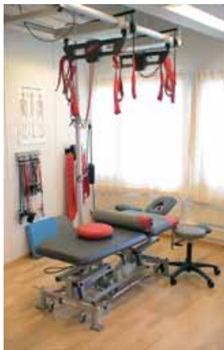
FIGUR 2 Arbeidsstasjon med glidende takopp-heng, slynger og benk.